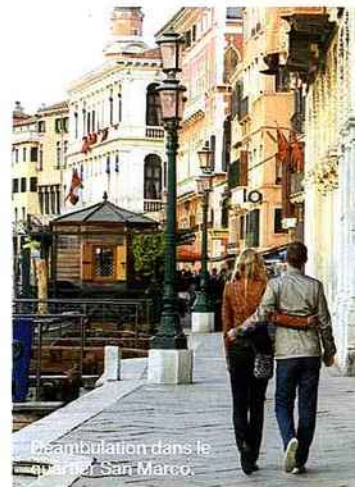
Flânerie dans le quartier San Marco.

Et pour sublimer son séjour dans la Sérénissime , on la vit comme ses habitants : en prenant un hébergement dans une demeure de charme, on l'aborde dans son intimité. On file faire ses courses au marché du Rialto, avec les étals colorés de ses marchands de fruits et légumes, et à quelques mètres de là, à la Pescheria, un marché de poissons haut en couleur avec ses mouettes et ses vendeurs qui vous interpellent. On suit les habitués jusque dans les barcari qui se sont multipliés autour du marché. Ce sont des bars à vin typiques dans lesquels on déguste un verre