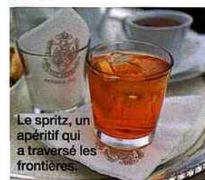
Le spritz, un apéritif qui a traversé les frontières.