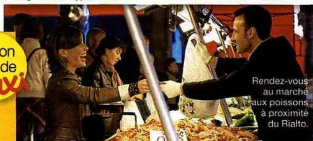
Rendez-vous au marché aux poissons à proximité du Rialto.