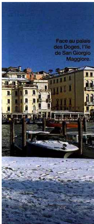
Face au palais des Doges, l'île de San Giorgio Maggiore.