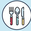
Table de 10 personnes maximum

Matériels loués désinfectés après chaque location